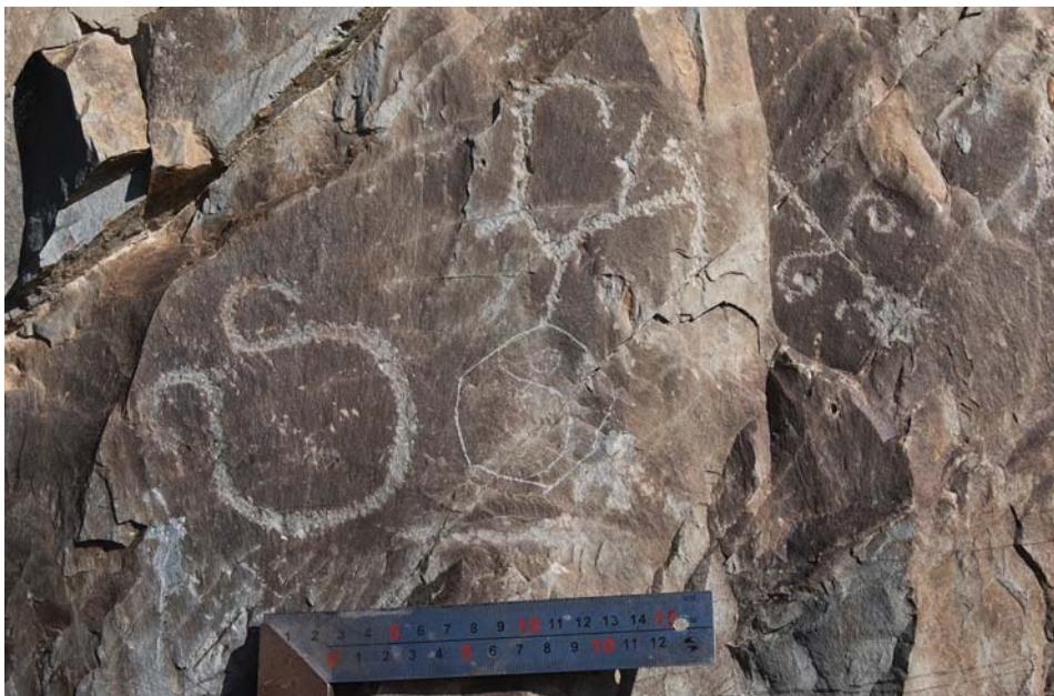
Рис. 1. Алтай, урочище Уле. Плоскость 1. Петроглифы-тамги.