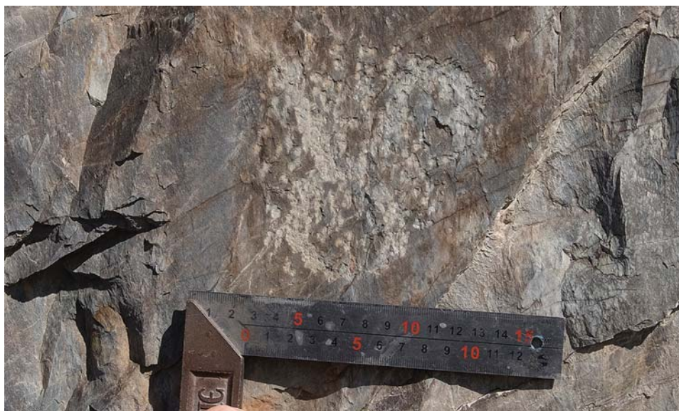
Рис. 4. Алтай, урочище Уле. Плоскость 3. Петроглиф-тамга.

Вполне очевидно, что изображения выполнены рукой не одного мастера, однако из-за сплошного подновления рисунков крайне сложно установить последовательность создания композиции.