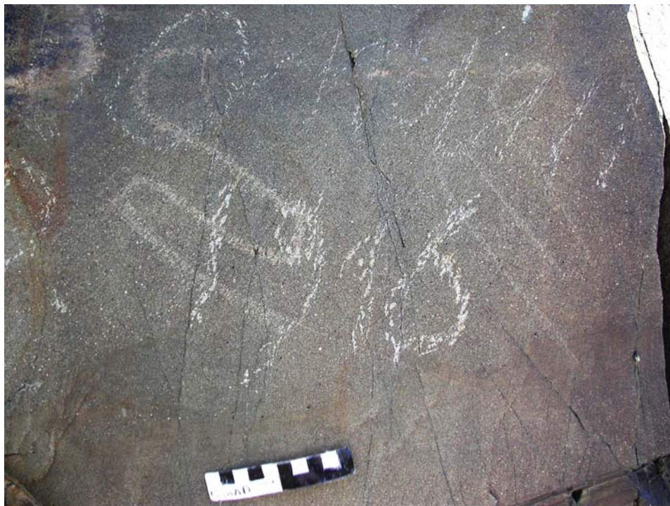
Рис. 3. Семиречье, Тамгалы. Две тамги в форме змеи.