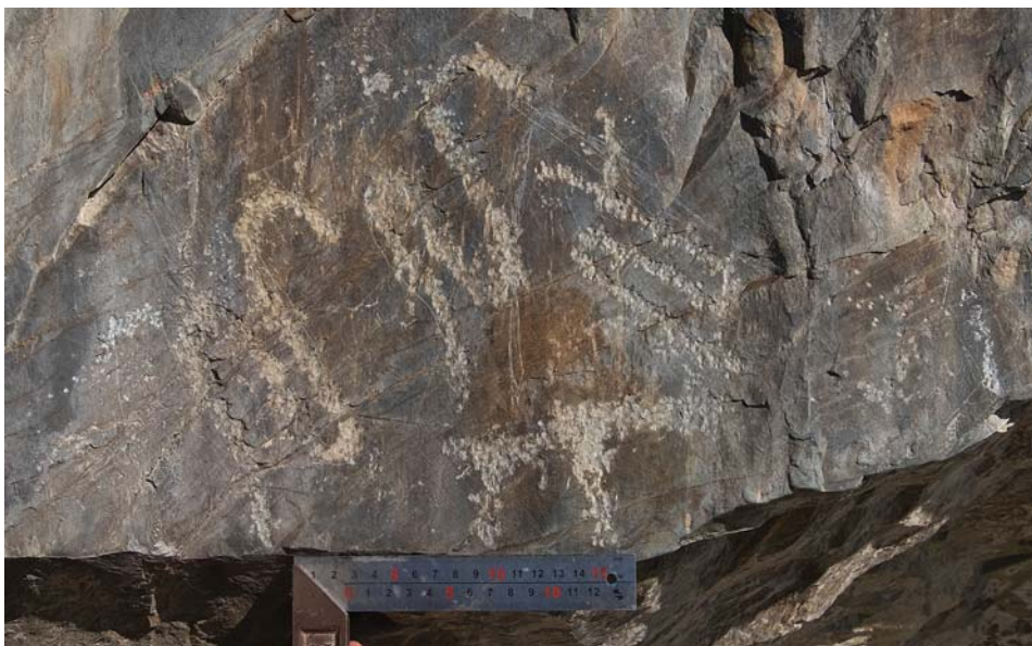
Рис. 2. Алтай, урочище Уле. Плоскость 2. Петроглифы-тамги.

му краю скалы, условно образуя верхний фриз, доминируя над изображением омегообразной тамги. Сделанные наблюдения позволяют прийти к мнению, что знаки наносились на поверхность скалы не одновременно и, по-видимому, разными людьми. Омегообразная тамга занимает наилучший участок поверхности и могла появиться на скале раньше других изображений.